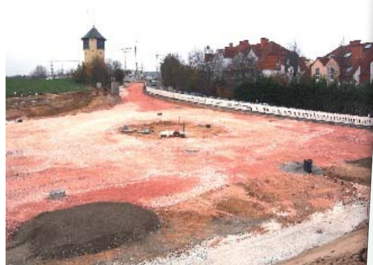
Einer der beiden Kreisel ist fertiggestellt, der zweite bereits erkennbar.

Die CDU Bad Soden setzt sich zudem für eine Geschwindigkeitsbeschränkung auf Tempo 30 vom Ortseingang an der Wilhelmshöhe bis in die Stadt zur Alleestraße ein.